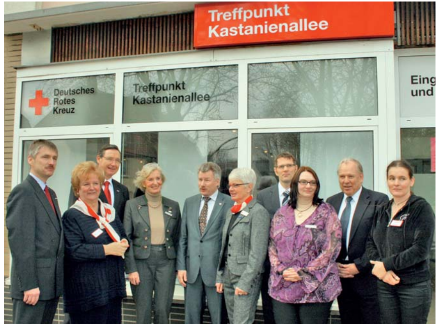
Zur Eröffnung der neuen Räumlichkeiten trafen sich die »Offiziellen« vor dem Eingang.

nicht erbringen können. Genau hier setzt das neue Angebot des DRK an. Neben ambulanter Pflege durch die DRK-Sozialstation bietet der Träger Älteren jetzt auch die Möglichkeit, im Falle von Krankheit und Pflegebedürftigkeit in der Tagespflege betreut und gepflegt zu werden. Dieses Angebot verbessert die