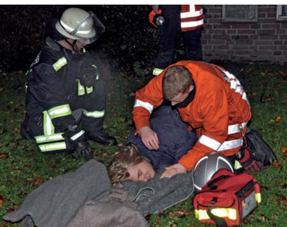
Feuerwehrleute und Sanitäter versorgen mit professionellen Handgriffen die »Opfer«.

Unter sehr realen Bedingungen. Denn bei dem brennenden Haus handelte es sich um eines der KSG-Häuser, die kurz vor dem Abriss standen. Dadurch war es möglich, ein ganzes Wohnhaus in die Übung mit einzubeziehen. Aufgabe der Feuerwehr war es, Bewohner aus den oberen Stockwerken zu retten. Die Mieter, gespielt von Mitgliedern der Ortsfeuerwehr Bissendorf, wurden mit Hilfe von Steckleitern und einer Drehleiter nach draußen gerettet oder, mit Fluchthauben ausgestattet, durch das verbrauchte Treppenhaus in Sicherheit gebracht.