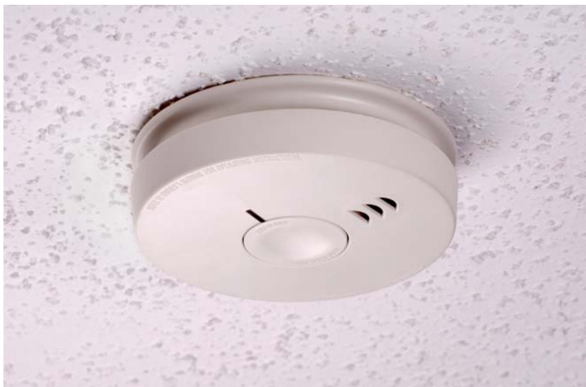
Unauffällig sitzen die kleinen Lebensretter unter der Zimmerdecke. Mit hoher optischer Präzision messen sie schon geringste Mengen Rauchgas – und geben Alarm.

Um diese Gefahr effektiv einzudämmen, hat die KSG alle Wohnungen mit Rauchmeldern ausgestattet.