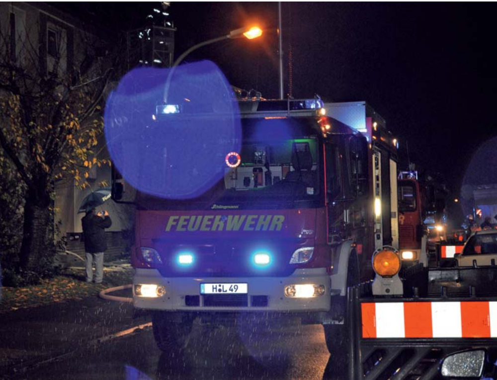
Nacht, Regen, Kälte – die Blaulichter der Feuerwehr flackern über die dunklen Fassaden.

Feuerwehr Langenhagen übt in der Freiligrathstraße