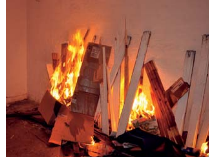
Im Keller sorgt der »Brandherd« für realistische Atmosphäre im Haus.

Wie echt die Übung wirkte, zeigte der große Andrang von Zuschauern aus den Nachbarhäusern. Insgesamt waren 80 Personen an der Übung beteiligt. Im Anschluss bedankte sich die freiwillige Feuerwehr Langenhagen bei der KSG, die solche Übungsprojekte mit der Bereitstellung von Abrisshäusern möglich macht.