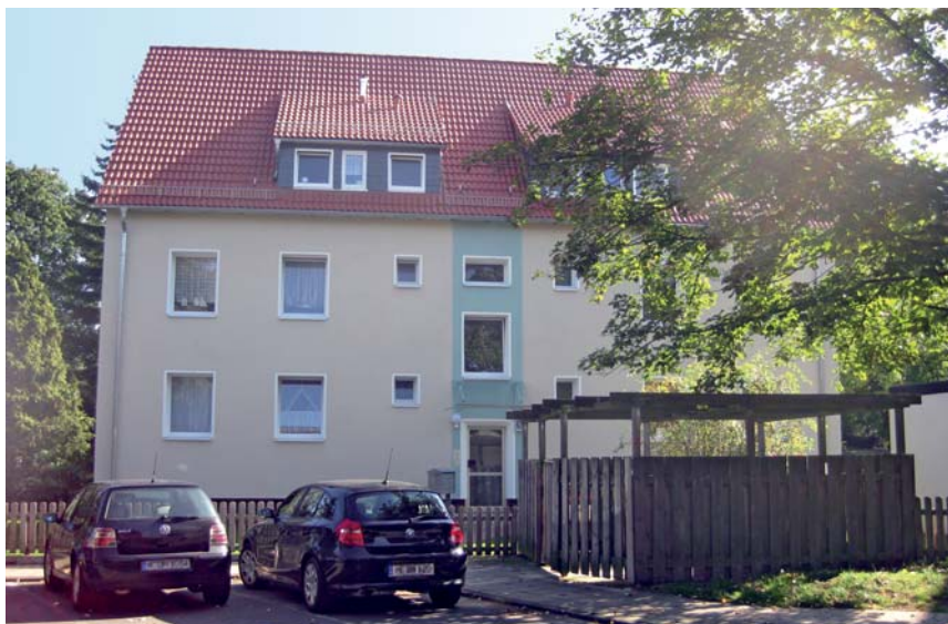
Frische Farben und ein dezentes Glasdach schmücken das Haus Nummer 11.

Im Vordergrund stand neben der Verbesserung des Wohnkomforts vor allem die energetische Aufrüstung der Häuser 11, 13, 15 und 17. Dazu wurden zunächst die Fenster erneuert und eine Vollwärmeschutz-Fassade aufgebracht. Auch die Dächer erfuhren eine Erneuerung. Um zu verhindern, dass wertvolle Wärmeenergie über das Dach abgegeben wird, ließ die