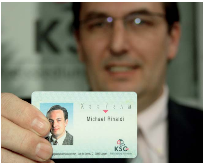
So sieht er aus: Die TeamCard der KSG wird von jedem Mitarbeiter gern vorgezeigt.

In den allermeisten Fällen geht es den Tätern darum, möglichst schnell an Bargeld zu kommen. Dazu erschleichen sich die Kriminellen im Vorfeld das Vertrauen der Opfer. Meist geschieht dies, indem sich die Haustürbetrüger zum Beispiel als Polizisten, Mitarbeiter der Stadtwerke oder eines Wohnungsunternehmens ausgeben. Letzteres geschah im November 2010 im Bereich der Kreissiedlung. Ein junger Mann klingelte bei einer Mieterin und stellte sich als KSG-Mitarbeiter vor. Um einen Sachverhalt zu klären, müsse er die Kontoauszüge der Mieterin einsehen und überprüfen.