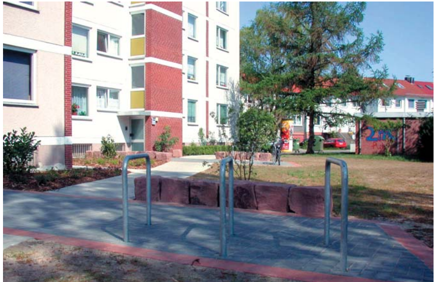
Niedrige Pflanzungen und Trockenmauern halten den Außenbereich stets einsehbar.

Ein Beispiel ist die Erschließung von Neubaugebieten: Hier wird von vornherein eine hofbildende Bauweise, etwa um eine Wendeanlage oder Gemeinschaftsfläche herum, bevorzugt. So werden sichere Aufenthaltsbereiche unter den Augen der Nachbarn geschaffen. Besonde-